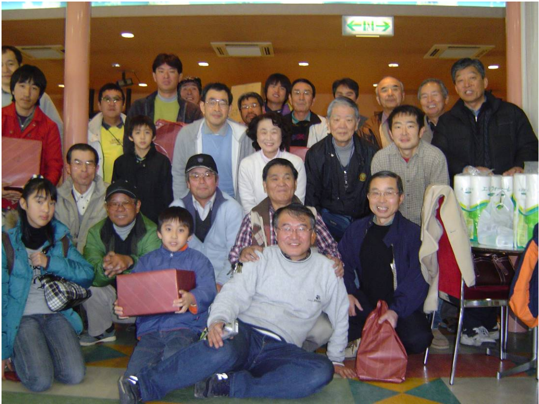
参加者のみなさん