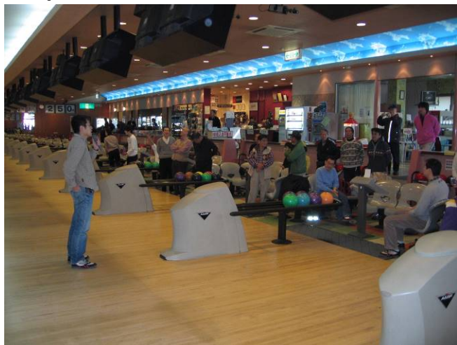
大会前の会長挨拶