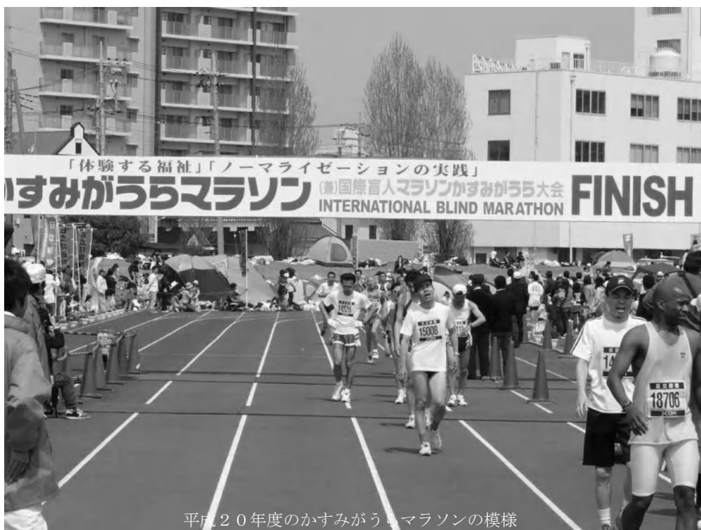
平成20年度のかすみがうらマラソンの模様