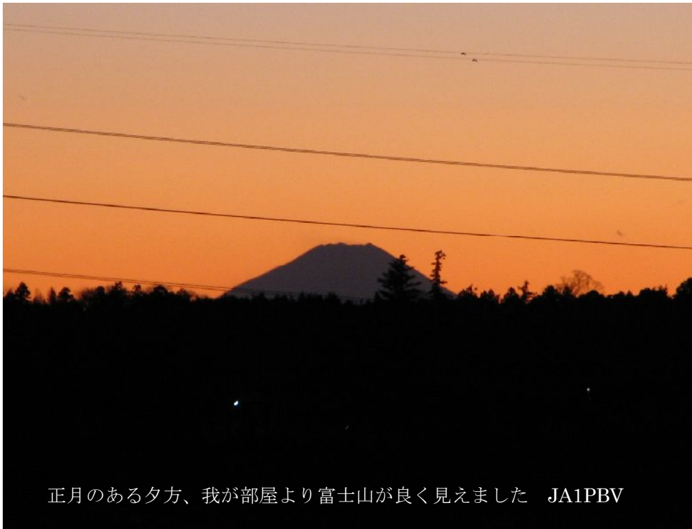
正月のある夕方、我が部屋より富士山が良く見えました JA1PBV