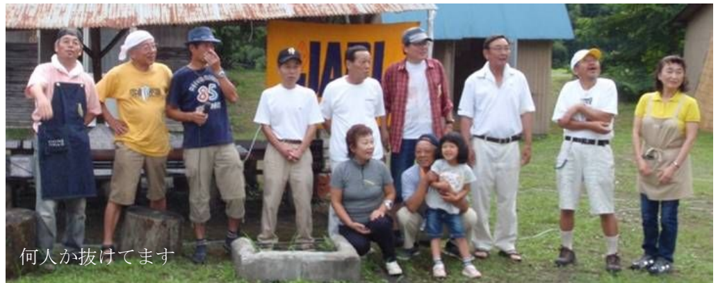
何人が抜けてます