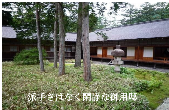
派手さはなく閑静な御用邸

宮へ行くがここを訪れる人はまだ少ない。この御用邸は、大正天皇の皇太子時の静養所として建てられたもので今上天皇が皇太子時代の疎開先にも利用された。平成12年に一般公開となった。非常に閑静な場所で建築物も国の重要文化財となっている。内部写真撮影も自由なのがよい。江戸、明治、大正時代の建物が混在しながら調和していて派手さはないが質実剛健である。次は、世界遺産の輪王寺、東照宮、さすがに人は多く、今流行の中国富裕層か？団体で押しかけている。