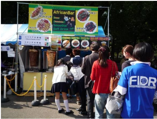
↑ワニハンバガーに列をなす皆さん