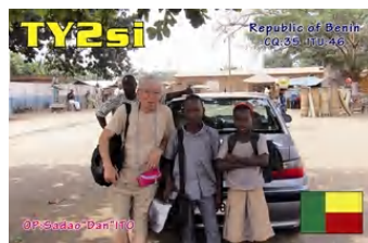
JA1PBVの西アフリカ運用のQSL Card