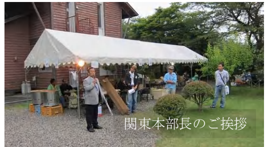
関東本部長のご挨拶