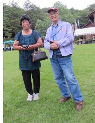
←根本前関東本部長は我がテントに長期滞在。