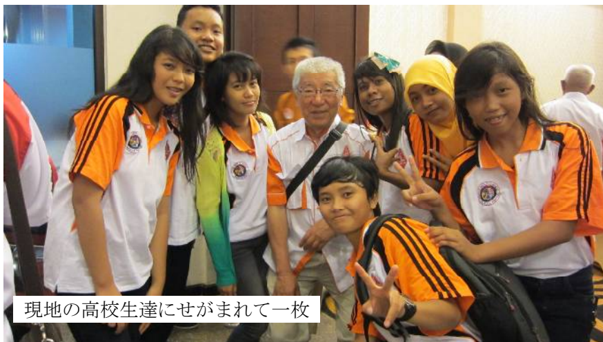
現地の高校生達にせがまれて一枚

超！蒸し暑く (30℃、湿度 70%)、お湯な んてめったに使 えず水シャワー、 手掴みで食べる 食事、トイレッ トペーパー無し、 雑魚寝、日本語 は通ぜず、豚肉 は皆無、洗濯機 は無し、自由時 間なく何時も誰