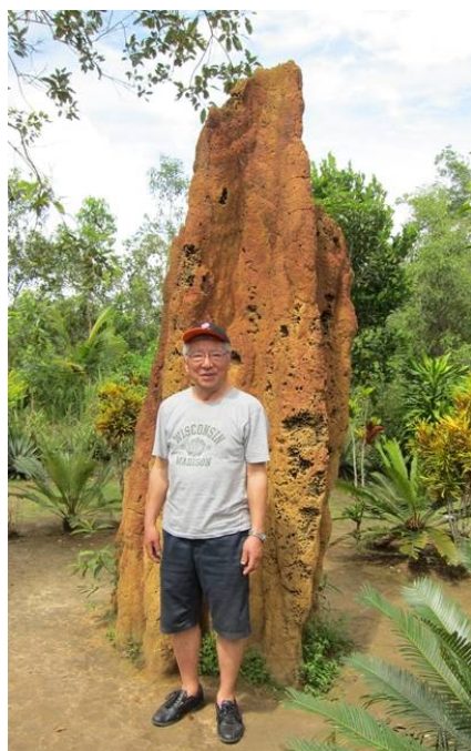
国境付近で蟻の家 (巣) の前で