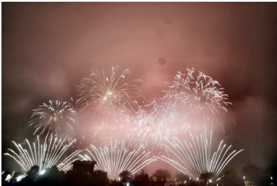
雨天決行、雨中での土浦花火大会