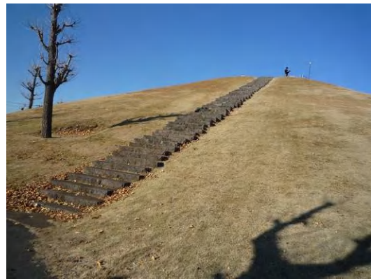
右上：ピラミッドのような小高い丘