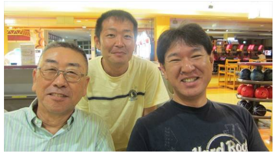
第 10 レーン : JE1ONG、JO1LEA、JE1OON