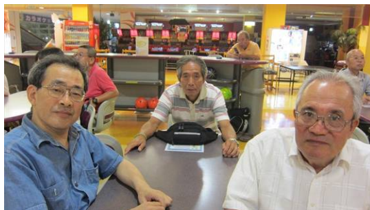
第 6 レーン : JG1JLU、JE1RLK、JF1TCS