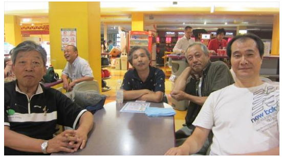
第 8 レーン : JG1TPW、JG1NUV、7M4OZD、JL1LLM