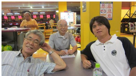
第 5 レーン : JF1MFE、JH1WGP、JA1CCN