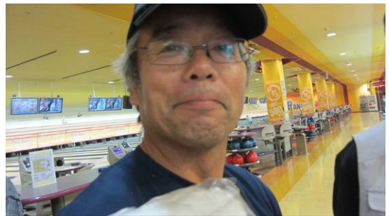
見学者 : JF1KZD