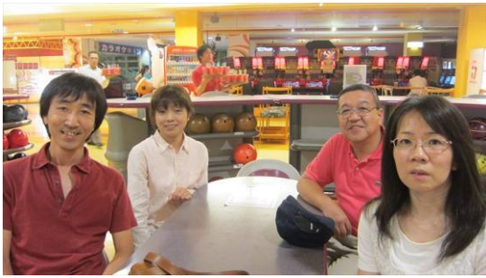
第 7 レーン : 7K4IJ、ゆくみ、JG1HJV、JG1HJV-XYL