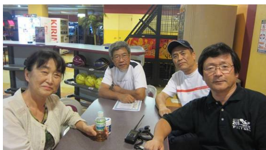
第 1 レーン : JN1VVE、JA1IOA、JL1SUJ、JJ1ATZ