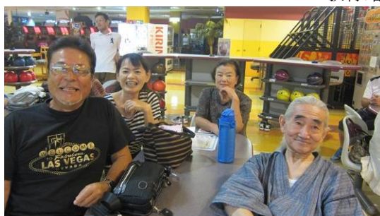
第 2 レーン : 7K4QHD、7K4QGK、JK1OIV、JI1WLL