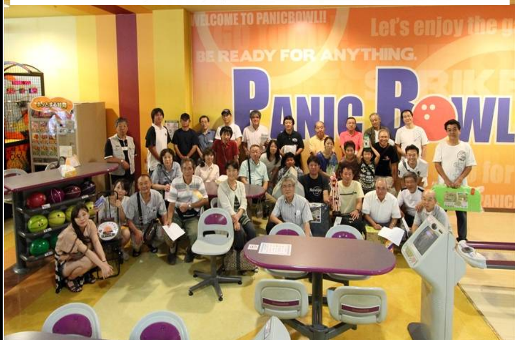
9月6日に行われたナイトボウリング大会に参加された皆さん