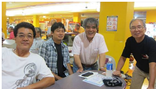
第 4 レーン : JG1WMN、いさお、JQ1SLZ、JA1LIS