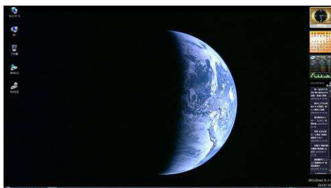
デスクトップ画面

また、現在 windows7 と windows8 に於いて windows10 にアップグレードしろとしつこく言ってきますが PreventOSUpgrade というフリーソフトで簡単に抑制できます。