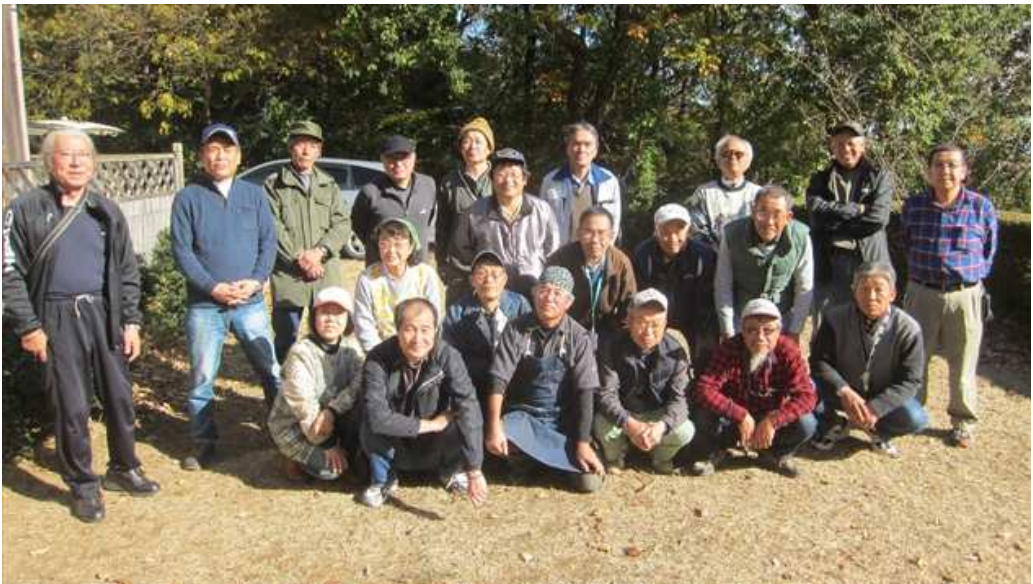
11月19日フォックスハンティング／アイボール会に 参加された皆さん