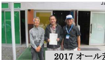
2017 オール茨城コンテスト表彰