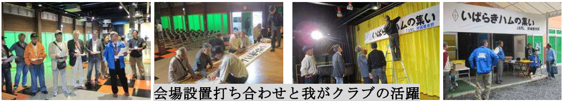
会場設置打ち合わせと我がクラブの活躍