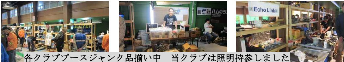
各クラブブースジャンク品揃い中 当クラブは照明持参しました