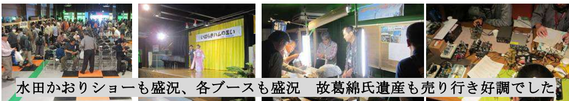
水田かおりショーも盛況、各ブースも盛況 故葛綿氏遺産も売り行き好調でした