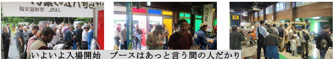
いよいよ入場開始 ブースはあっと言う間の人だかり