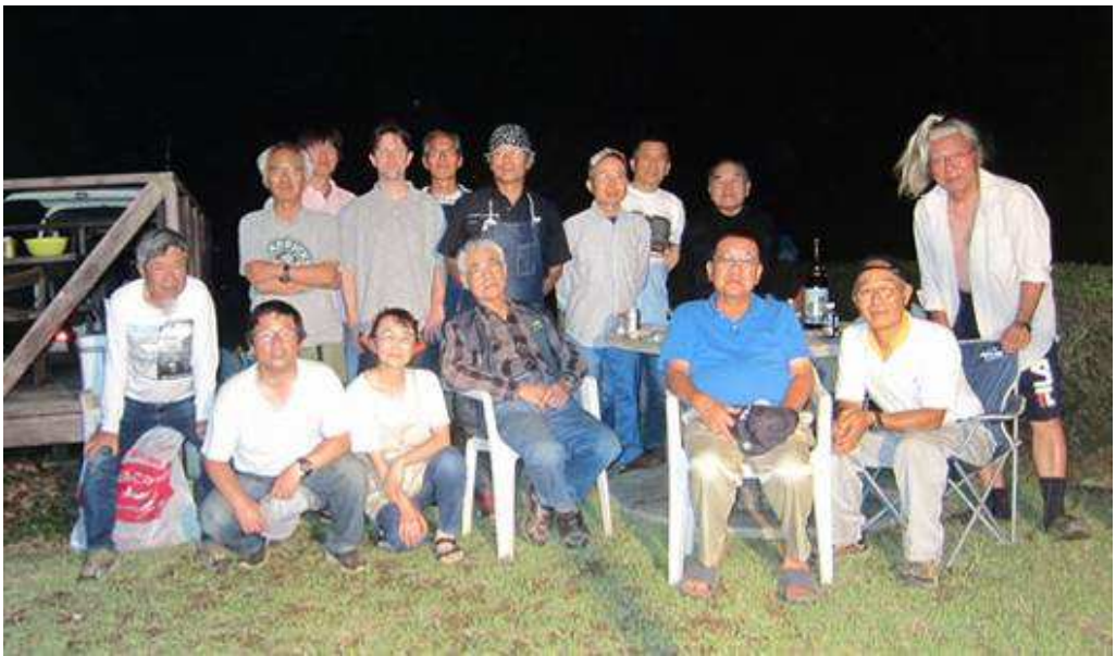
7月7日 6m&Down コンテスト開始前のアイボール会