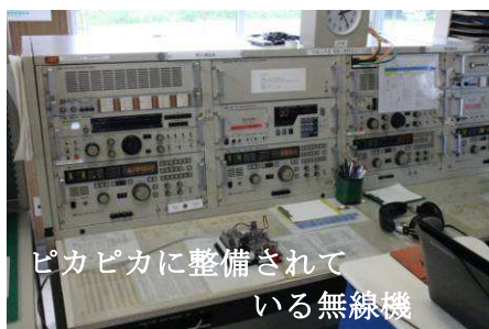
ピカピカに整備されている無線機