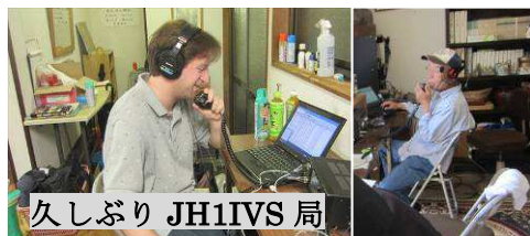
久しぶり JH1IVS 局