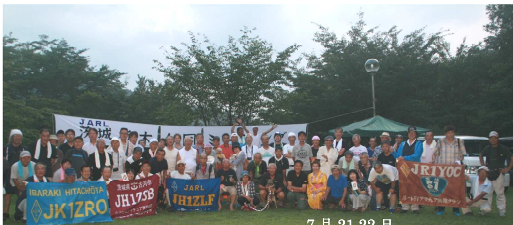
7月 21.22 日 茨城・栃木合同ミーティング