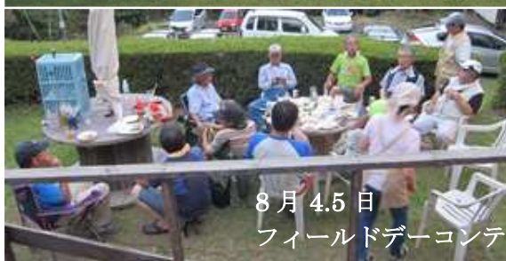
8月 4.5 日 フィールドデーコンテスト/アイボール会