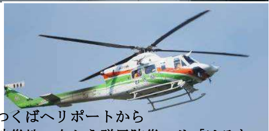
つくばヘリポートから 被災地へ向かう群馬防災ヘリ「はるな」

9 月 10 日（木）常総市三坂町付近の鬼怒川堤防決壊に伴う救助活動に近隣の県及び都の（東京、千葉、山梨、埼玉、群馬）防災ヘリが我が家から約 700m の「つくばヘリポート」に飛来し大変活躍しました。・・・同ヘリポートは給油と休息が目的・・・