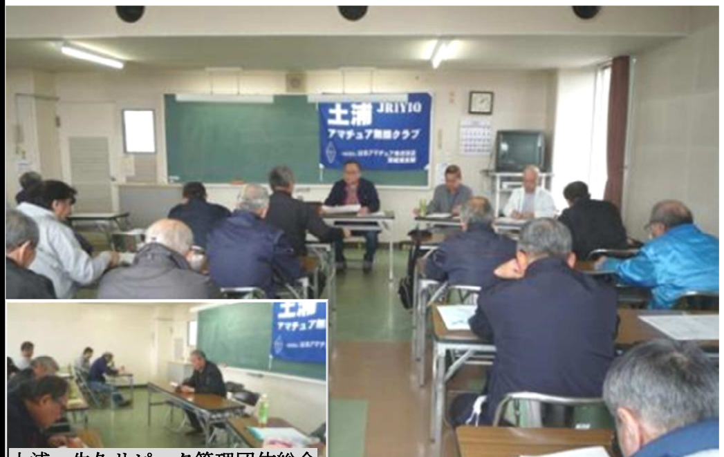
土浦・牛久リピータ管理団体総会