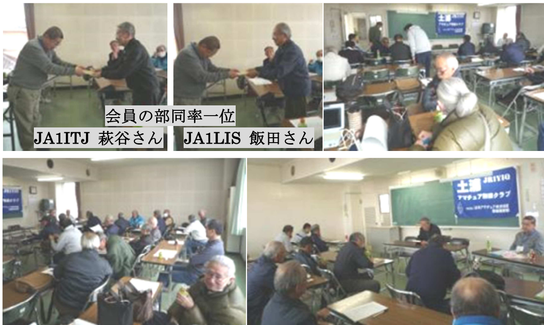
会員の部同率一位