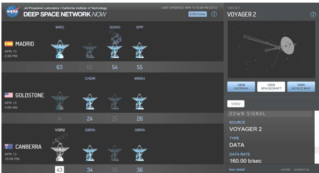
図 2 DSN NOW で探査機との通信状況をチェックできる

Deep Space Network の WEB サイトは英語で書かれていますが、心配いりません。Web ブラウザの翻訳機能を使えば十分読めます。気になった方は、ぜひ見てください。