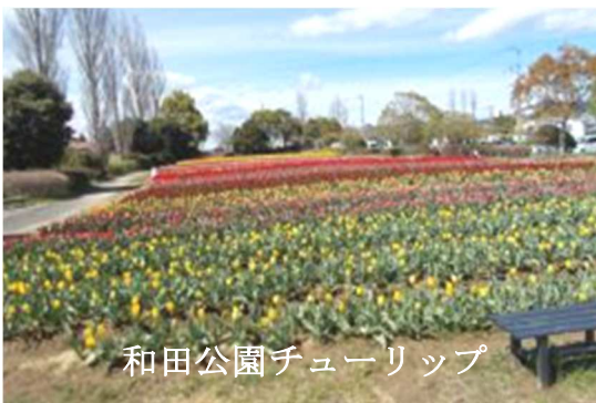
和田公園チューリップ