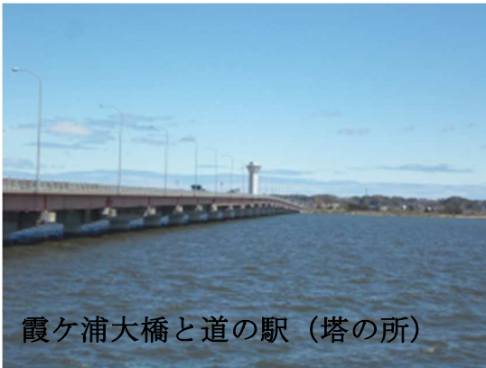
霞ヶ浦大橋と道の駅（塔の所）