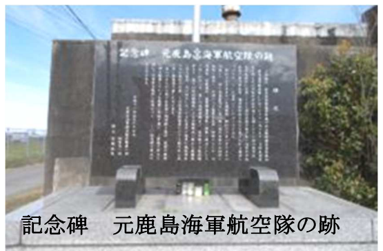
記念碑 元鹿島海軍航空隊の跡

元鹿島海軍航空隊碑文の一部；この碑は、元日本帝國海軍所属の水上機搭乗員養成基地「鹿島海軍航空隊」があったその一角であり、当時義務教育を終え又は旧制中学校途中で志願してきた飛行練習生、大学在学中に志願してきた飛行専修予備学生、海軍兵学校出身の飛行学生等、隊内各兵科の支えを受けながら優秀な「パイロット」を育成していたところである。・・・・・・・・場所；美浦村大谷