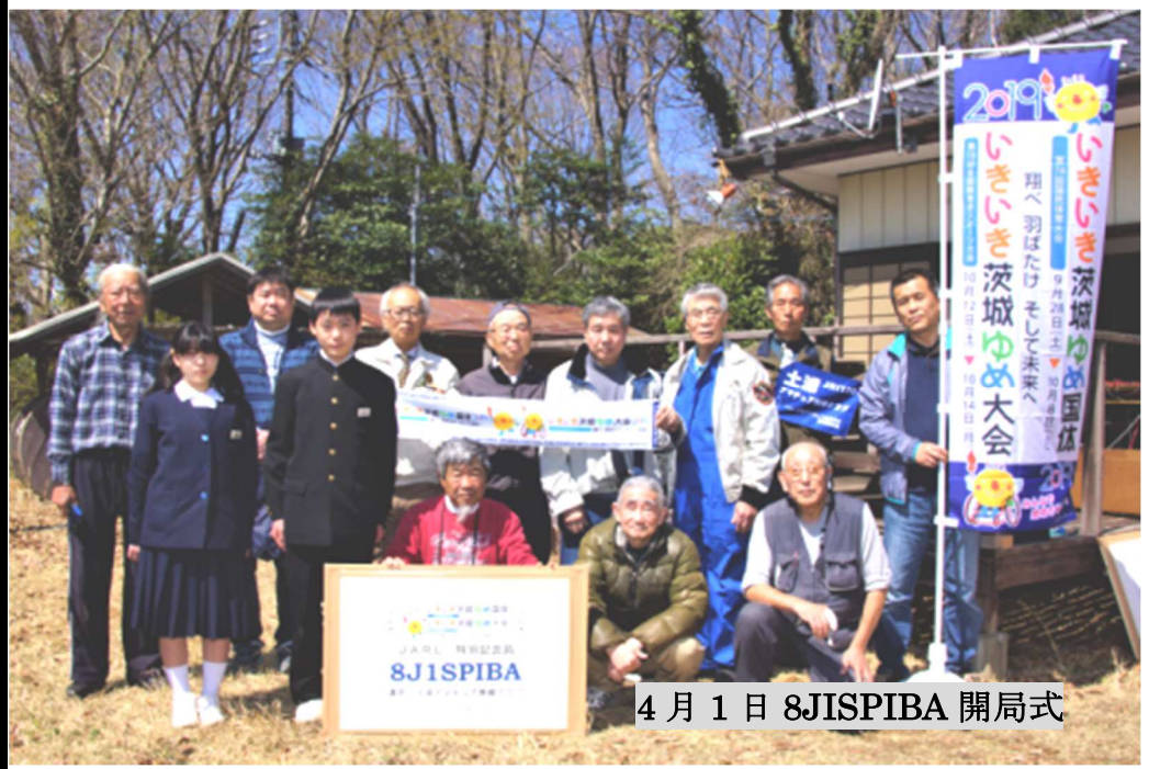
4月1日 8J1SPIBA 開局式