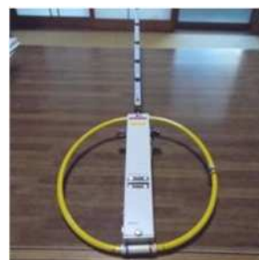
JL1GDO 柴田氏製 3.5MHz 受信機