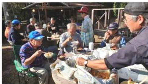
↑→美味しい料理に 声無し