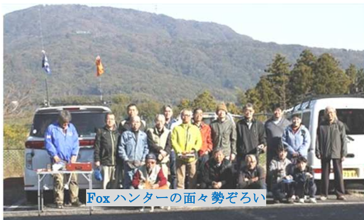
Fox ハンターの面々勢ぞろい

第二 FOX は、スタート後全員が出発し、第一 FOX の方に誘導した後、スイッチを入れる事にしました。なるべく混乱を防ぐためですが、中々スタート位置を離れないハンターが何人か居ましたので、15 分後ぐらいになってしまいました。