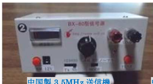
中国製 3.5MHz 送信機