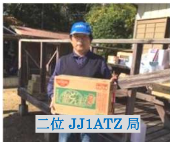
二位 JJ1ATZ 局