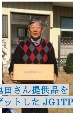
池田さん提供品を ゲットした JG1TPW 局