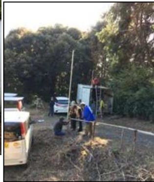
JA1PBV, JF1PEL, JE1RLK 各局

従来は倉庫周辺日照時間短かった。太陽電池からの送電線？の電柱架線工事中 JG1IIF, 7M4OZD, JQ1SLZ, 応援の各局