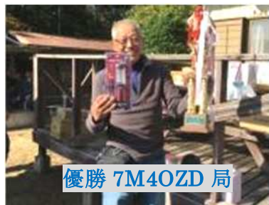
優勝 7M4OZD 局