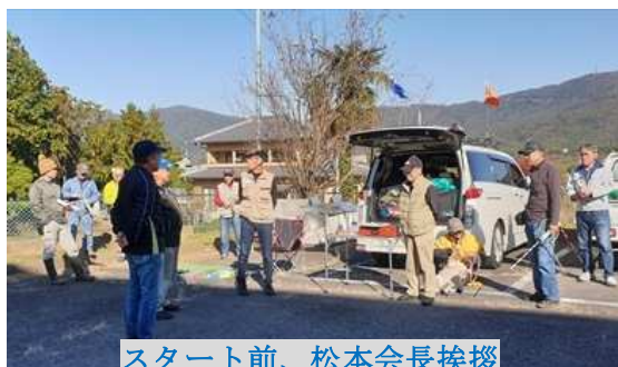
スタート前、松本会長挨拶

11 月 23. 24 日に県支部の ARDF が行われます。この記事が手元に届いたときには、遅いのですが、次の年にでも、出場して見てはいかがでしょうか。受信機はお貸しします。