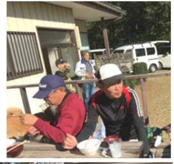
楽しいひと時を過ごしました