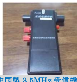
中国製 3.5MHz 受信機