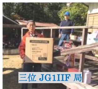
三位 JG1IIF 局