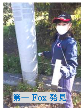
第一 Fox 発見