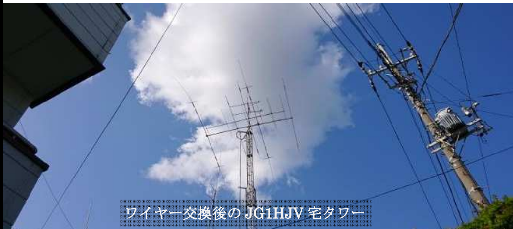
ワイヤー交換後の JG1HJV 宅タワー