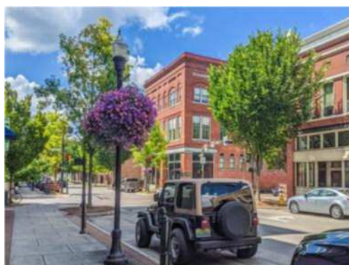
ハンツビル市の繁華街

「Natural Bridge」で撮影したものです。ここは今年5月頃から殆どの制限が解消されてコロナ前の生活に少しずつ向かっているように感じます。コロナが一日でも早く終息すること、皆様のご健康をお祈り申し上げます。