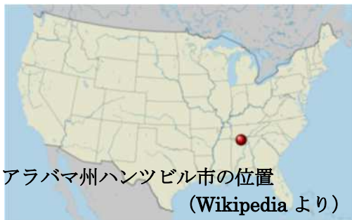
アラバマ州ハンツビル市の位置

ハンツビル市はアメリカ南部のアラバマ州の北の方にあります。大都市より人口密度が低くて、自然が豊かな街です。宇宙関係の施設「NASA Marshall Space Flight Center」がありますので、宇宙との関係でつくばに似てるとも言えます。