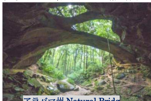
アラバマ州 Natural Bridge

過去にクラブのいろんな活動に参加できて感謝でいっぱいです。いつかまたアイボール会に参加したり、デイトンと一緒に行けたら嬉しいです。またお空でお会いしましょう。