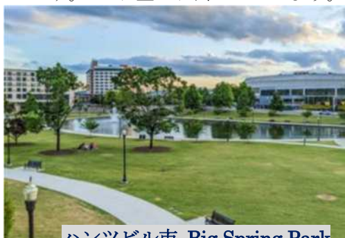
ハンツビル市 Big Spring Park