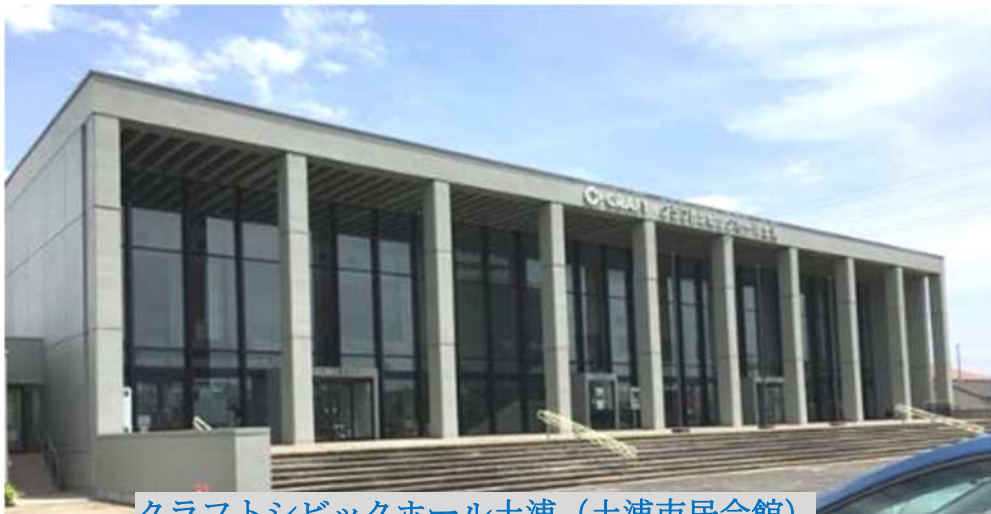
クラフトシビックホール土浦（土浦市民会館）

7月17日に開催される「2022 いばらきハムの集い」の会場です 前回は2019年にサテライト水戸・ライブ館で開催されました 3年ぶりとなります