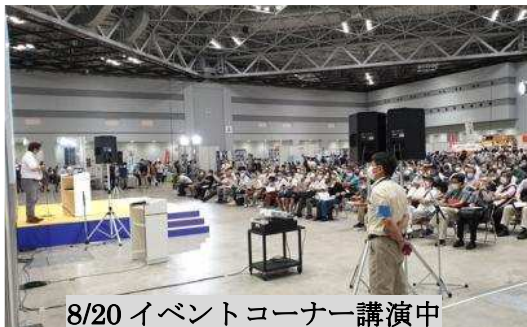
8/20 イベントコーナー講演中