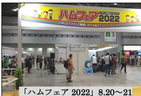
「ハムフェア 2022」 8.20～21