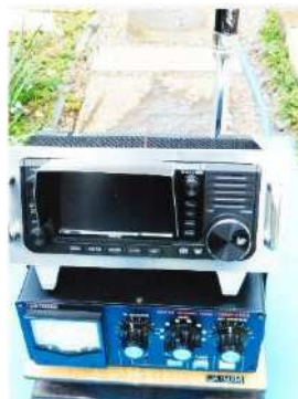
下から自作アースマット、自作カウンターポイズ巻き取り器、アンテナチューナー、自作パネルに IC-705