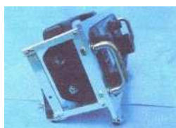
IC705 を自作パネルにセット