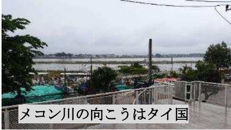
メコン川の向こうはタイ国

彼は7月30日成田からラオスに向け出発。同日到着しましたが、早くも荷物が届かないアクシデントに見舞われました。しかし、次の日の夕方には届いたようです。