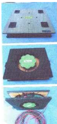
自作カウンターポイズ巻き取り器