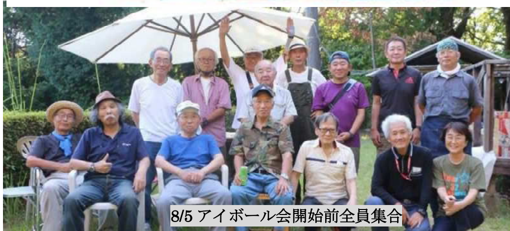
8/5 アイボール会開始前全員集合