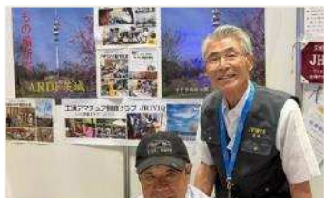
県支部 JA1IOA 局 JF1MFE 局