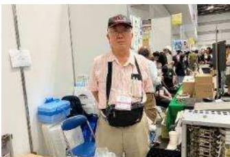
カソードタップ JA1OVF 局