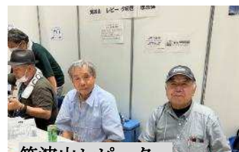
筑波山レピーター JE1NVN 局, JF1PEL 局