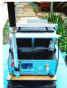
同左後ろからの写真