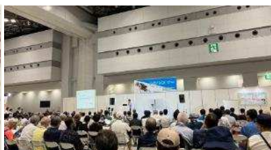
イベントコーナー