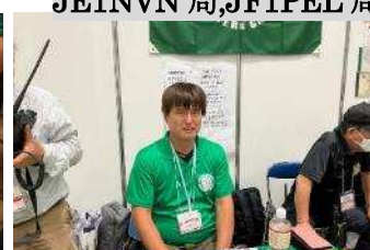
ジャパンアワードハンター グループ JA1CCN 局