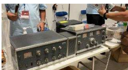
懐かしやトリオ TX-88D, 9R59D