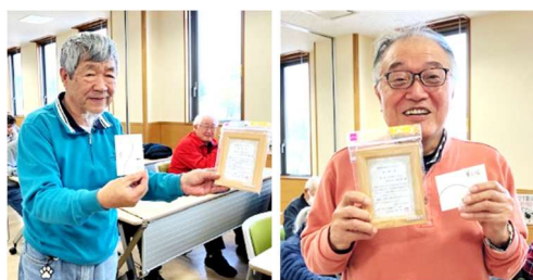
第一位 JA1IOA 局 第二位 JR1CCP 局