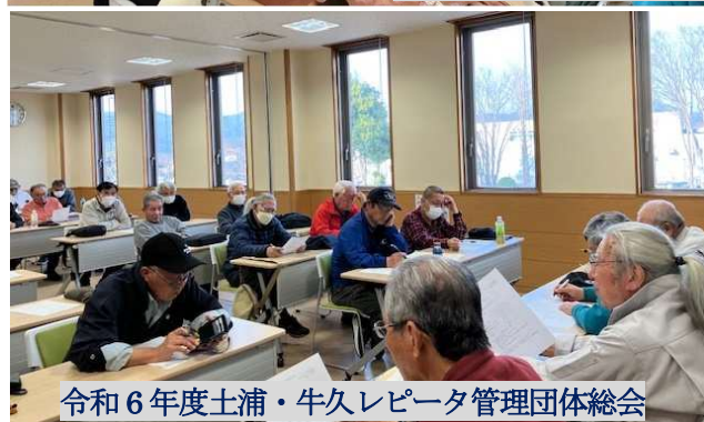
令和6年度土浦・牛久レピータ管理団体総会