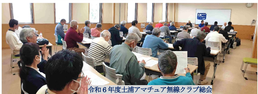
令和6年度土浦アマチュア無線クラブ総会