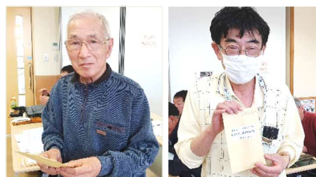
第一位 JA1MXM 局 第三位 JQ1CRS 局

*オンエアミーティング参加表彰式に 第一位 JH1PRV 局 第二位 JA1LIS 局 当日残念ながら欠席されました